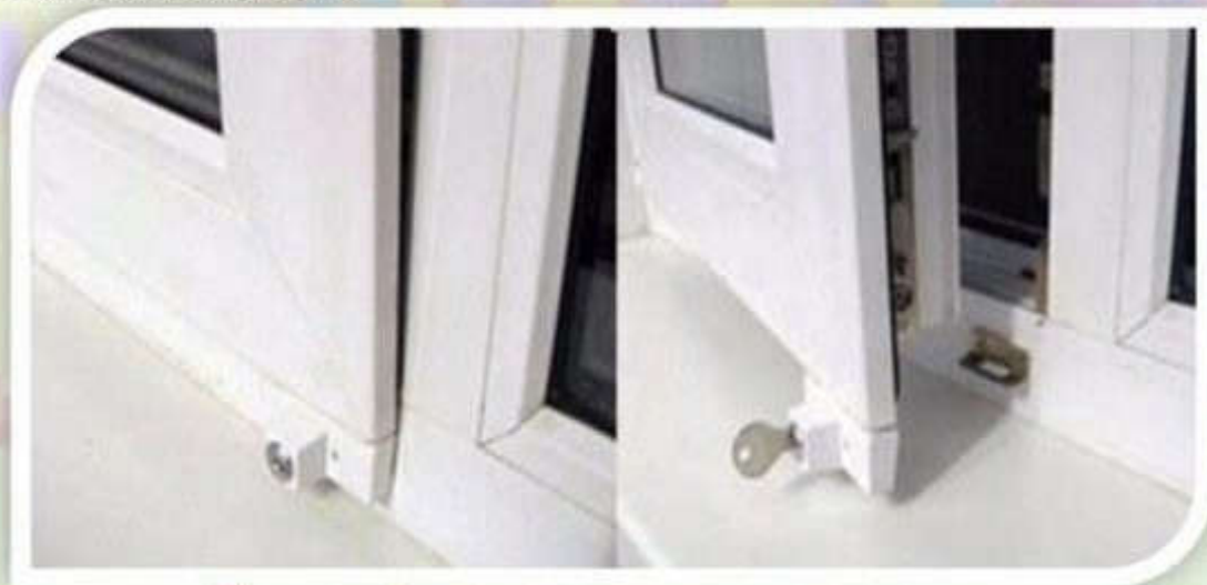
Замок блокировщик с ключом

Можно воспользоваться специальными замками блокираторами, которые предлагают установщики пластиковых окон.